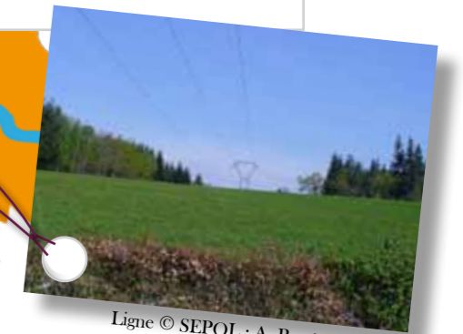
Ligne © SEPOL : A. Boyé

Acteurs économiques majeurs du territoire, RTE et ERDF sont amenés à travailler avec les structures animatrices de la zone Natura 2000, la LPO Auvergne et la SEPOL. La mise à disposition d'informations sur les espèces d'intérêt européen permet à ces entreprises d'intégrer la protection des oiseaux dans leurs travaux tels que l'entretien des lignes électriques. L'installation de balises avifaune sur les lignes électriques, destinées à limiter le risque d'électrocution ou de collision pour les rapaces, est prévue sur les lignes faisant l'objet de travaux.