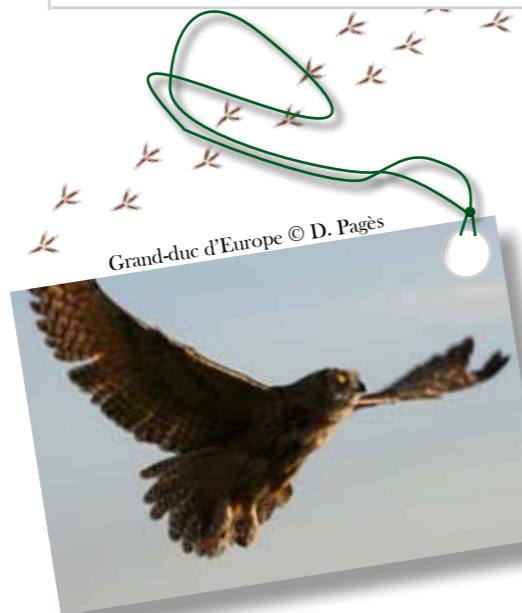
Grand-duc d'Europe

La présence de l'animateur Natura 2000 aux réunions de politique territoriale, sa participation aux montages de divers projets d'aménagements ou de manifestations sous différentes formes (consultation pour l'évaluation des impacts environnementaux d'un projet, travail de concertation avec les communes ou communautés de communes, etc.), ou la mise en place de partenariats avec les structures animatrices, tous ces éléments permettront une meilleure prise en compte de la protection des oiseaux.