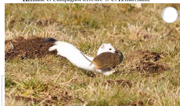
Hermine et Campagnol terrestre