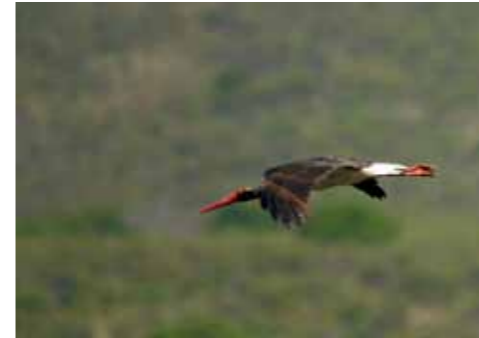
Cigogne noire