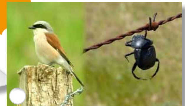
Pie-grièche écorcheur © LPO Auvergne : R. Riols & son Lardoir (garde manger) © B. Raynaud

Les réponses à ces questions permettront de proposer la meilleure solution aux éleveurs pour leurs bêtes et pour les petites bêtes!