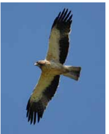
Aigle botté

est désormais possible de mettre en œuvre pour préserver ces espèces fragiles, dans le cadre du dispositif Natura 2000.