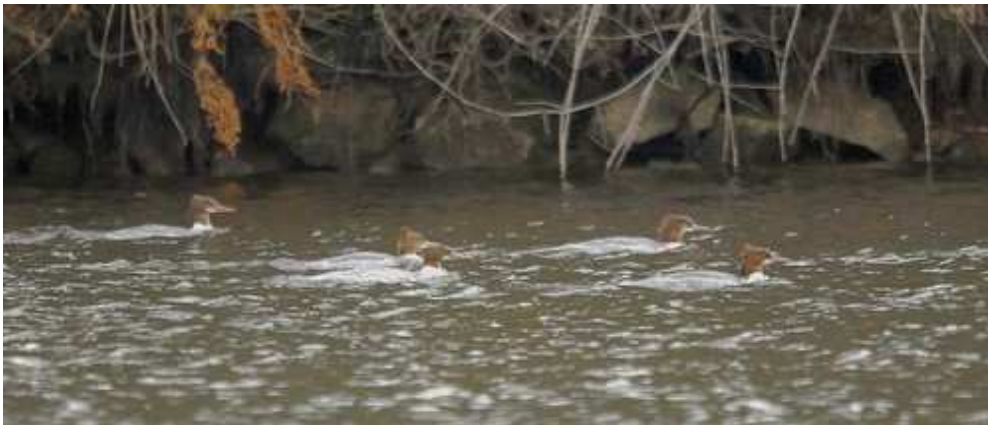
Photo 6 : Harles bièvres, Mergus merganser , Saint-Pardoux (87), décembre 2010

Un afflux de Harles bièvres est survenu lors de l'hiver 2010/2011 à nos latitudes, on notera que tous les oiseaux cités sont de type femelle.