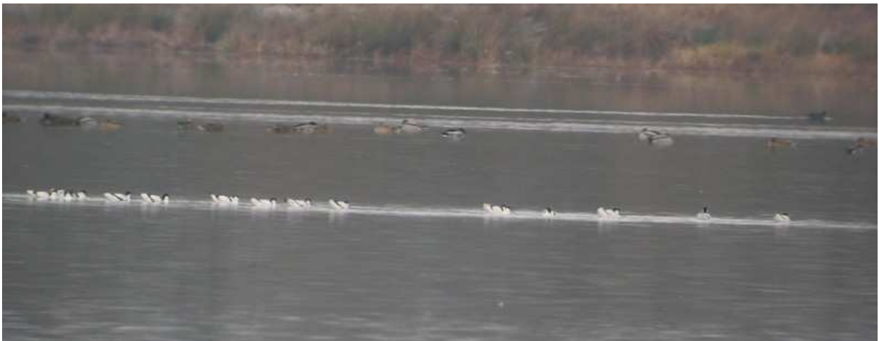
Photo 15 : Avocettes élégantes, Recurvirostra avosetta , Lussat (23), novembre 2010.

Ces observations correspondent à des oiseaux en halte migratoire. On notera que fin novembre un groupe de 99 avocettes stationnait à l'étang de Sault dans l'Allier, à 30 km de l'étang des Landes (Obs Stéphane Combaud, LPO Auvergne).